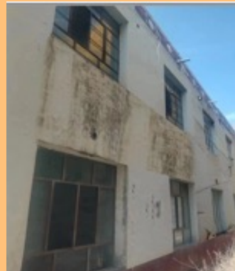
Avant la rénovation

La construction de l'école primaire de GABU (district de Jianzha ) avait été financée par la fondation en 2009. En raison des différences extrêmes de température et d'humidité dans la région, entre un hiver très sec et très froid, et un été très chaud et humide, le bâtiment scolaire était de plus en plus endommagé. Le Gouvernement local n'ayant pas été en mesure de financer la rénovation de ce bâtiment délabré, il a demandé l'aide de la fondation. Au printemps 2023, le Conseil de la Fondation a approuvé un budget finalement raisonnablement réduit de 18'300 CHF. Après un sprint final impressionnant de la part de l'entreprise de construction, l'enseignement a pu reprendre au début de la nouvelle année scolaire, au début de Septembre 2023.